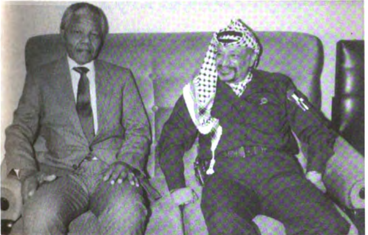
مع الرئيس نلسون مانديلا